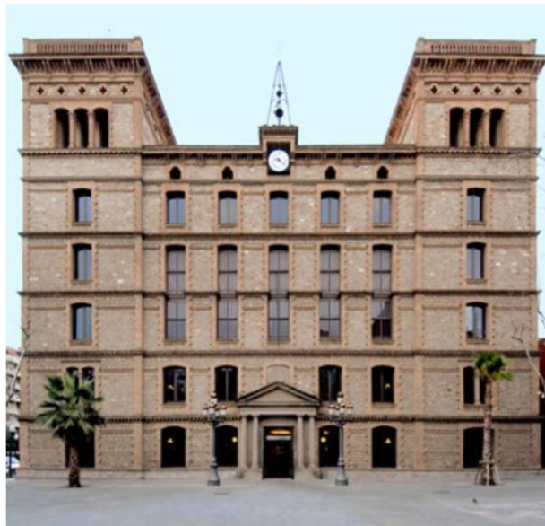
Edifici El Rellotge (Edifici número 12)

Adreça: Recinte de l'Escola Industrial, Carrer del Comte d'Urgell, 187, 08036 Barcelona