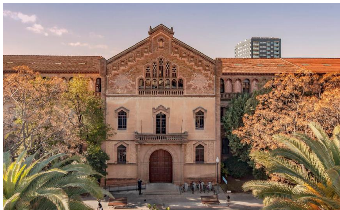
Edifici de la Residència Ramon Llull (Edifici número 5)